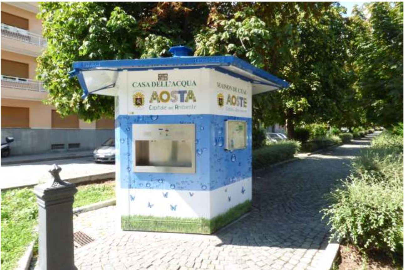
Casa dell'acqua installata nel Comune di Aosta

Il Consorzio BIM (Bacino Imbrifero Montano) della Valle d'Aosta sostiene da sempre quest'importante iniziativa offrendo contributi ai Comuni che desiderano incentivare questa buona abitudine, che contribuisce a ridurre l'utilizzo di imballaggi in plastica monouso, i costi di trasporto e offre un prodotto fresco, a "KM zero" e a un prezzo finale competitivo.